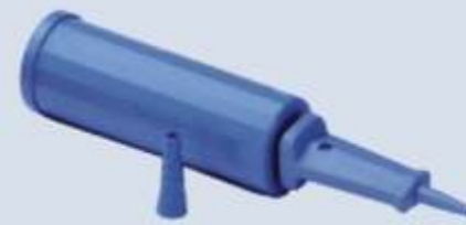
Pompe a mano ZAP