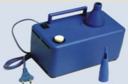
Pompe elettriche Z-32